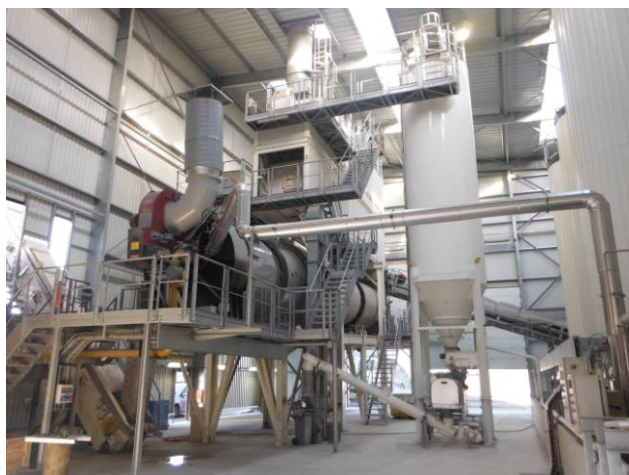
Poste d'enrobage RF Néo