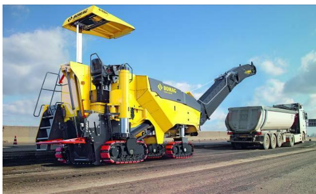
Fraiseuse à froid 1000/35